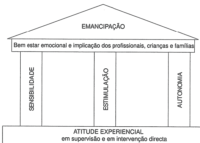
Figura 2 O esquema do templo: abordagem experiencial em IP